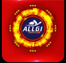
volatilidade / Prêmio